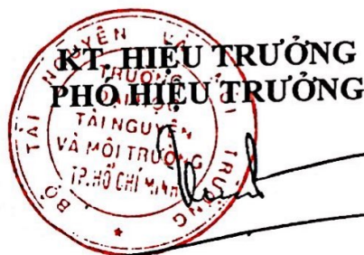
Vũ Xuân Cường